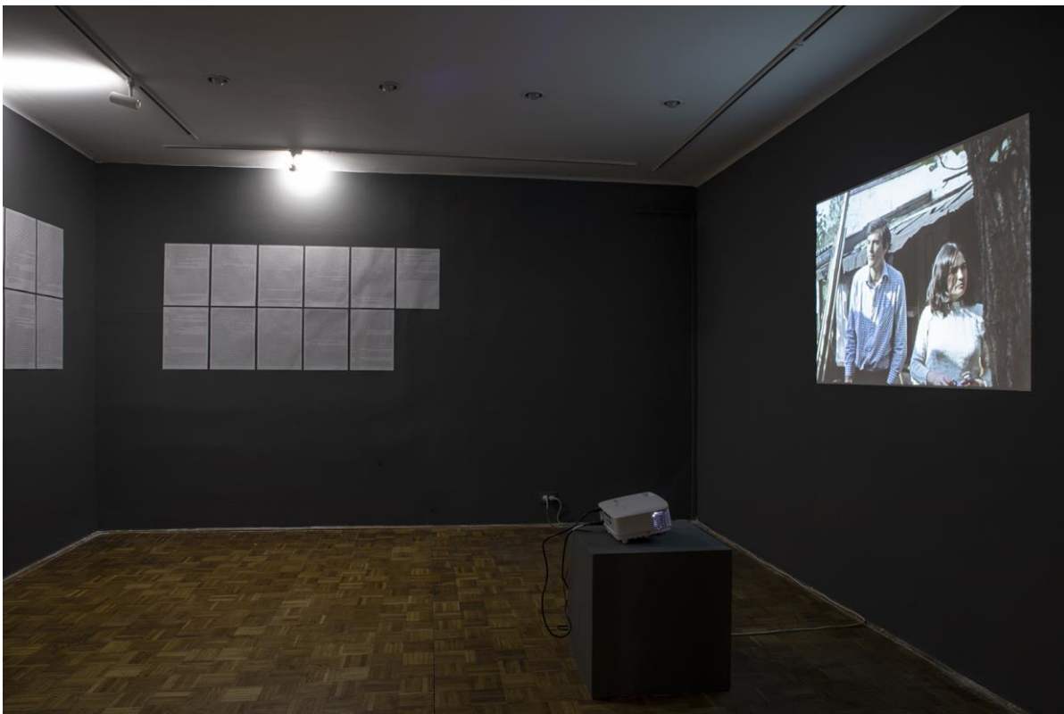
Zoran Popović Filmski autoportret (prvi deo). Radnik, tipomašinstva Miodrag Popović: o životu, o radu, o slobodnom vremenu