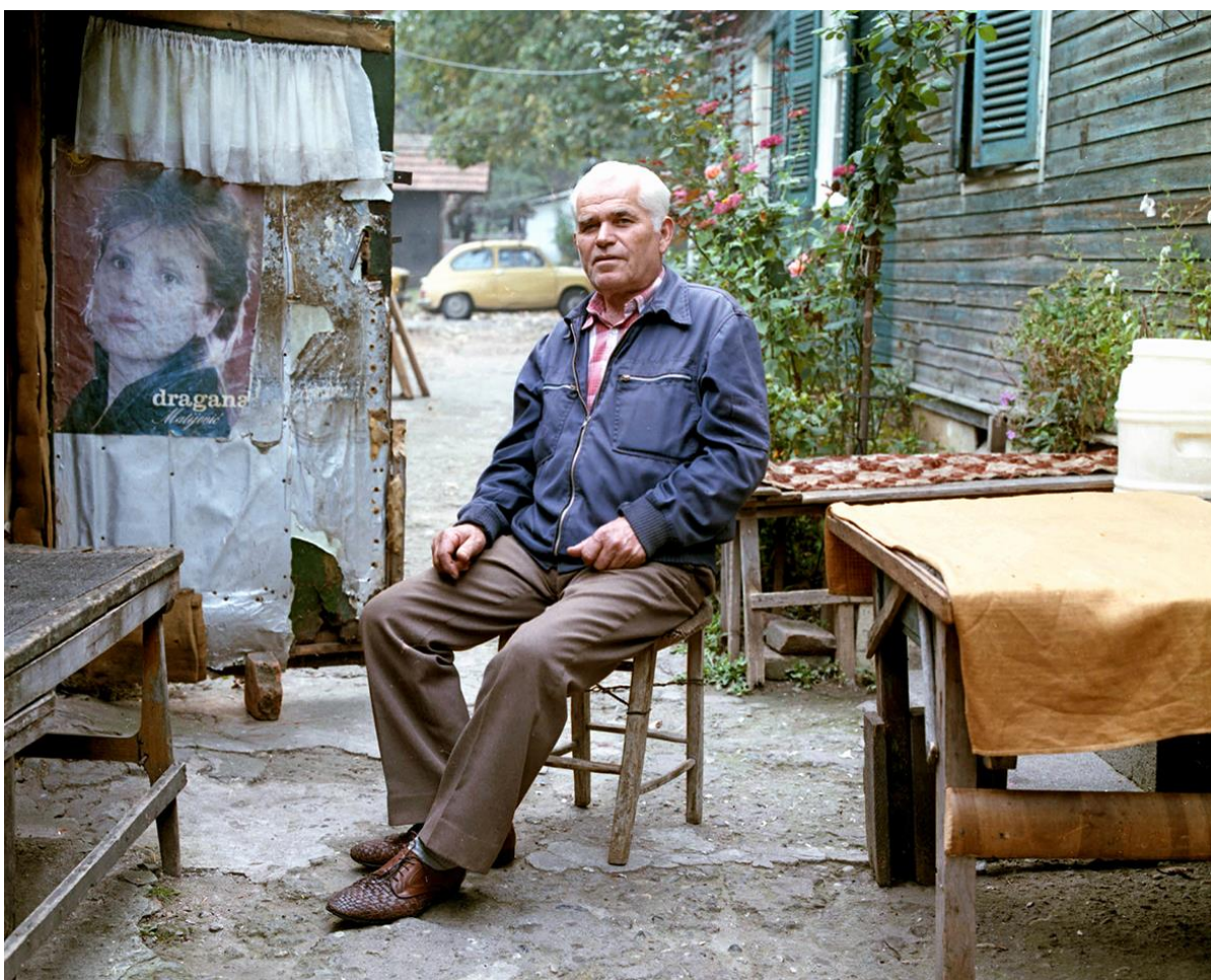
Ivan Arsenijević, Ljudi iz baraka

Fotografije iz serije Ljudi iz baraka pre svega su orijentisane na pojedinca i na njegovu personalnost, koju autor vidi kao ključnu za razumevanje pitanja zajednice. Arsenijevićeve fotografije su pažljivo estetski i formalno kontrolisane, kao i kada se radi o nivou pažnje u smislu komunikacije i uspostavljanja odnosa sa ljudima koje je fotografisao, jer svedoče o uzajamnoj saradnji i poverenju. Istovremeno, one potvrđuju da od namera fotografa zavisi kakav se odnos uspostavlja sa akterima i kakva se emotivna stanja tom prilikom grade.