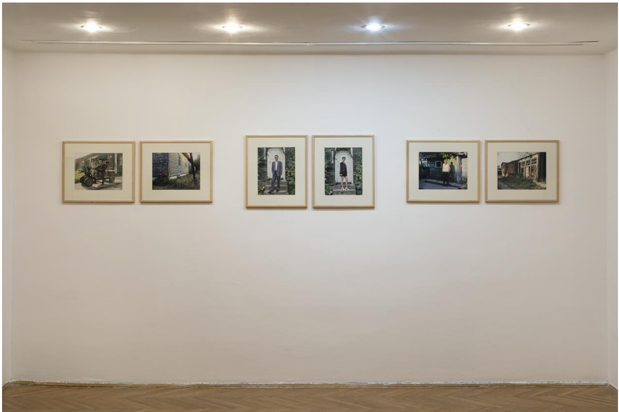
Ivan Arsenijević, Ljudi iz baraka , foto dokumentacija CEF©