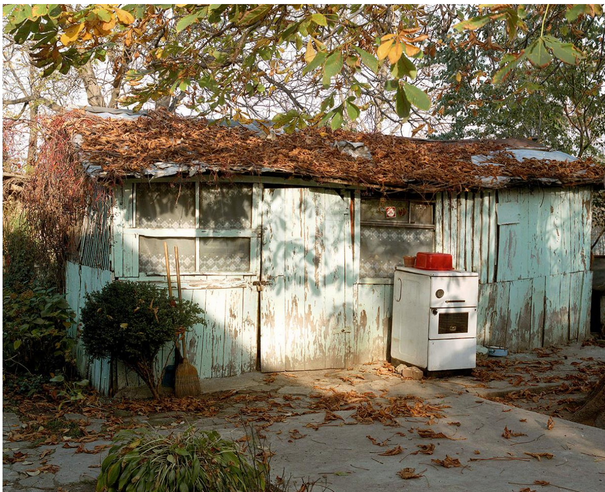
Ivan Arsenijević, Ljudi iz baraka

Kao Kragujevčanin, Arsenijević je radu na seriji Ljudi iz baraka pristupio iz pozicije fotografa neposredno i blisko upoznatog sa okolnostima vezanim za Staru radničku koloniju. Fotografisanje je otpočeo u trećoj godini studija i projekat razvijao tokom narednog perioda, tako da je naposljetku zauzeo poziciju njegovog diplomskog rada. Serija od oko 60 fotografija prvi put je prikazana 2000. godine u Umetničkoj galeriji Narodnog muzeja u Kragujevcu.