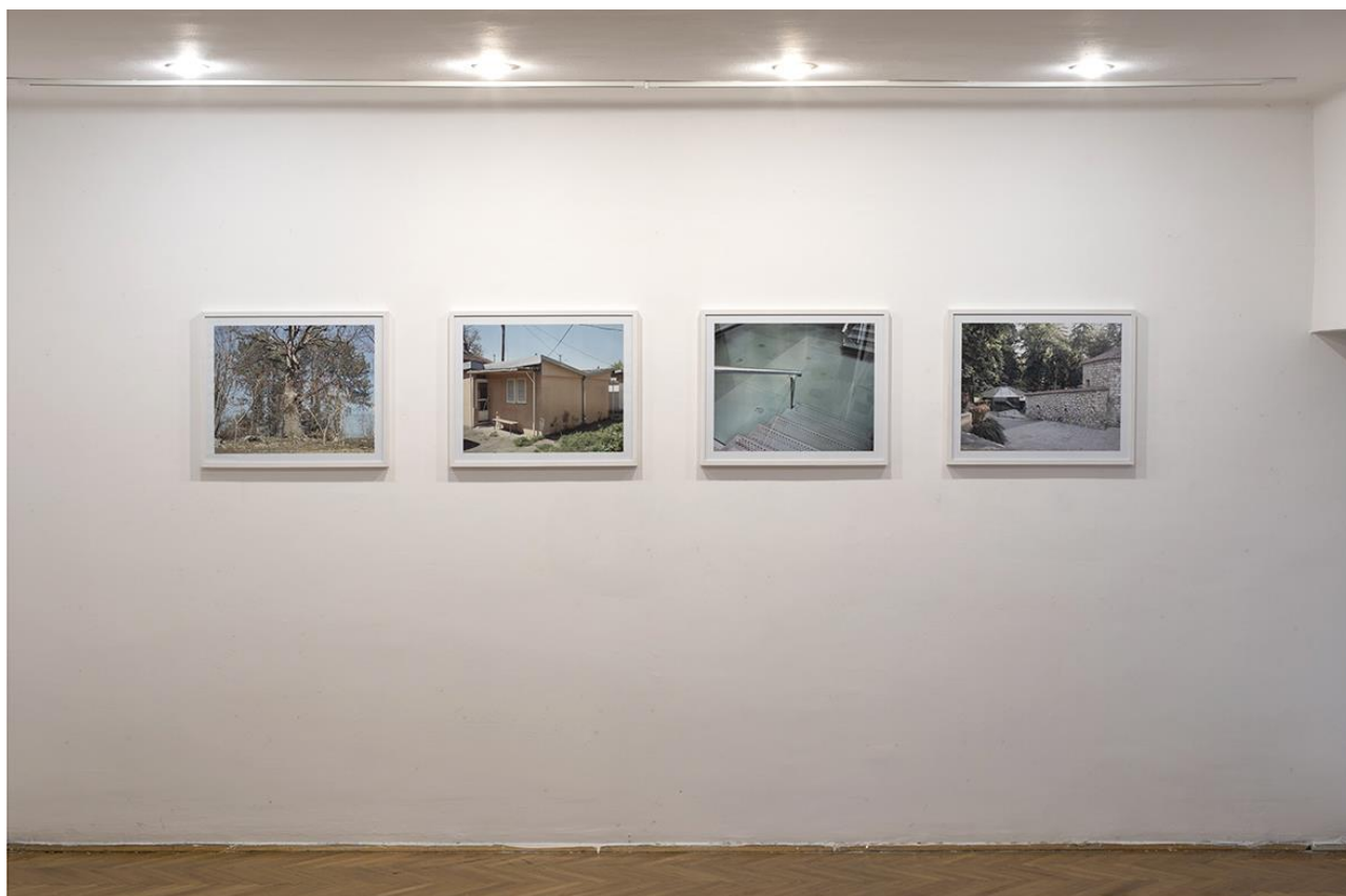
Ivan Petrović Klimatsko mesto