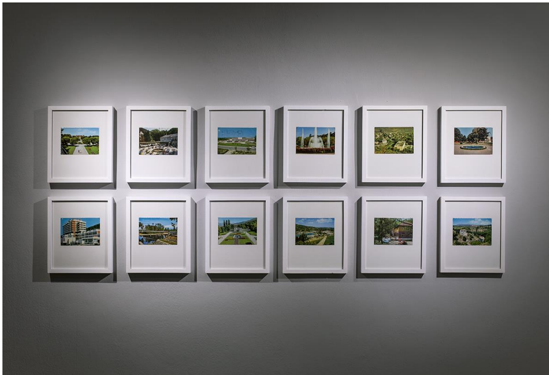
Bliskost i razlike III