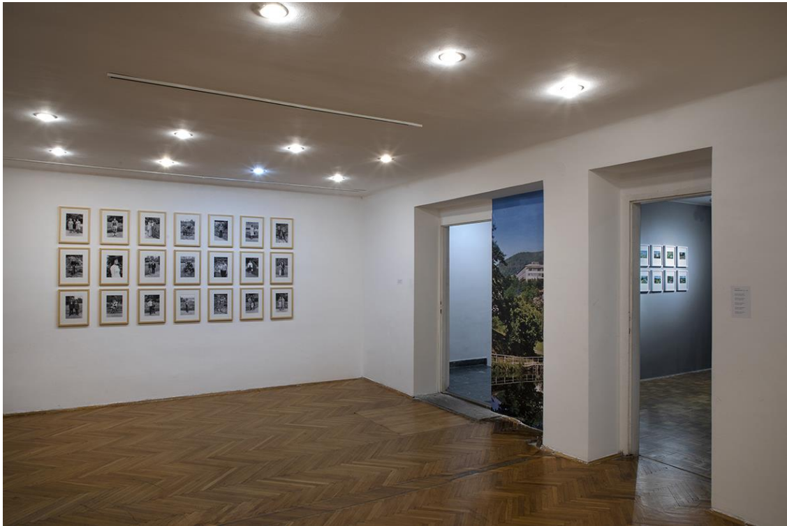
Bliskost i razlike III