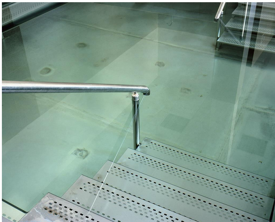
Ivan Petrović Klimatsko mesto #0231, [2021] (Sokobanja)

U radu Klimatsko mesto (2012–2023) prikazani su motivi koje je Petrović fotografisao u srpskim banjama i njihovoj bližoj okolini. Arhitektura, izvori, predeli, arheološki ostaci, vikend naseobine, kupatila, bazeni, parkovi, ljudi – čine predmet interesovanja Petrovića u ovom radu. Na izložbi je prikazano pet fotografija u boji, mahom iz Sokobanje. Izbor u kome je preovladao jedan toponim može se objasniti čestim Petrovićevim boravljenjem u ovom mestu, ali i sedmogodišnjom pauzom u radu na ovoj seriji.