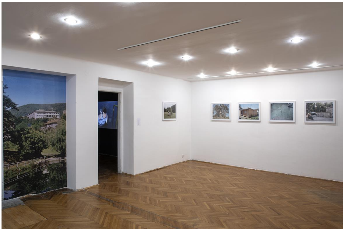
Bliskost i razlike III