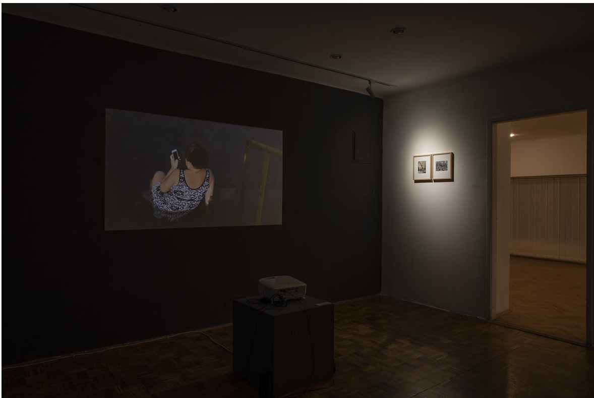
Aleksandrija Ajduković No name rivijera / Rehabilitacija duše i tela

Oba rada, jedan kao sinteza „video-škartova”, sa upotrebljenim sirovim zvukom, i drugi, kao određeni vid skretanja pažnje sa informativne, ekranske slike na fotografije, koje su sada kao predmeti u galeriji date u manjem obimu, predstavljaju modele reinterpretacije postojećih sadržaja sa preusmerenom temom.