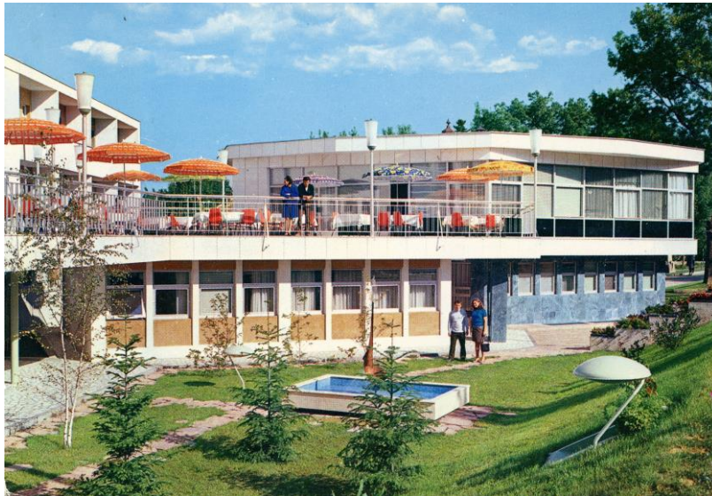
Vrnjačka banja kolekcija CEF

Razglednice su široko zastupljena tema o kojoj je objavljen veliki broj tekstova i knjiga. Kao nekada najmasovniji medij za distribuciju fotografije, razglednice istovremeno čine značajno područje popularne kulture. Njihova utilitarnost je doprinela određenoj vrsti uopštavanja sadržaja i tema, čime je izgrađen karakterističan model vizuelnih predstava o kulturnim i društvenim pojavama.