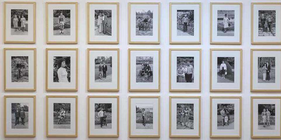
Fotografska radnja "Krčmarević" foto dokumentacija CEF©

Banjski fotograf, sa „čitavom svojom mitologijom ulepšanog sveta“, nudio je uslugu koja je udovoljavala ukusu tadašnjeg stanovništva. Pored ponuđenih rekvizita u vidu dečijih automobila, ljuljaški-konjića, indijanskih vigvama, kočija sa konjskom zapregom, aviona ili kulisa u obliku flaše sa oznakom vode VRNJCI, značajni su i srpska narodna nošnja i kostimi sa egzotikom divljeg zapada.