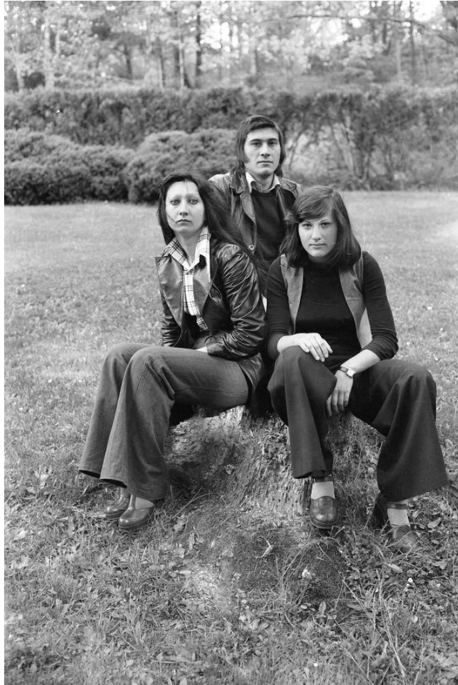
Fotografska radnja "Krčmarević"