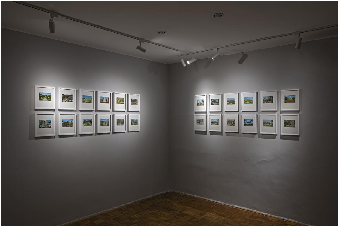
Bliskost i razlike III