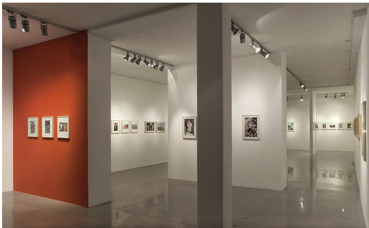
Dragan Petrović, Veseli svet , Salon MSU Beograd

...Treća srećna okolnost je svakako iznenadni interes institucija umetnosti za dokumentarnu fotografiju, što je u direktnoj vezi s promenom paradigme i što je omogućilo da se fotografska produkcija, čak i kada se radi o dokumentarnoj i reporterskoj fotografiji, porodičnim albumima, nađenim fotografijama i čitavom spektru slučajno nastalih fotografija, čita s više pažnje i poštovanja. To je doprinelo otkrivanju jednog fenomena u dokumentarnoj fotografiji, pa i u fotografiji uopšte kao sredstvu komuniciranja, a to je njena slojevitost, koja reprezentuje ne samo značenja o snimljenom događaju već vrlo često i mnogo kompleksnija značenja o samom društvu i društvenim odnosima, običajima, mentalitetu i istinama, koja iz dubljih slojeva slike iznenada proviruju kroz pukotine da bi pokazala svu snagu i višeznačnost ovog medija. A, nekako, iako skrivena, i estetika je počela da se ukazuje u novom svetlu.