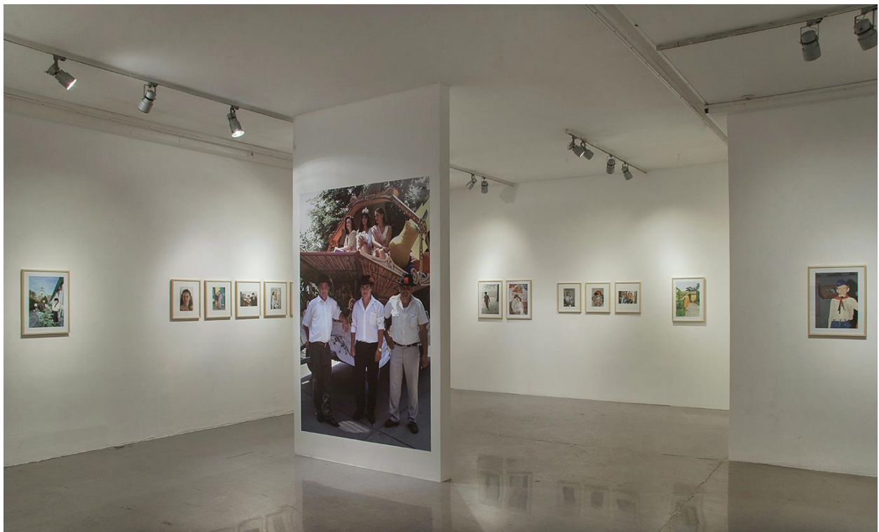
Dragan Petrović, Veseli svet , Salon MSU Beograd

pozitivno otkaçene prizore, ostaje za jednu dužu raspravu. No, sledeća činjenica je nesporna: Dragan Petrović je uspeo i nedvosmisleno uspeva da u kontinuitetu izdvaja potpuno jedinstvene prizore s platformi narodnih i tradicionalnih obiçaja. Ono što Dragana Petrovića çini velikim umetnikom jeste njegova sposobnost da sa haotične platforme stvarnosti izdvoji one „uzorke“ koji predstavljaju fascinantna kulturološki miks sačinjen od autentičnih aktera, etno-pozadine, zakasnele modernosti zaogrnutu u ruho lokalnih fantazmi o modi i ponašanju – humor i šegaćenje kao temeljni diskurs srpskog mentaliteta.“ (tekst: Slavko Timotijević , Dragan Petrović - fotograf )